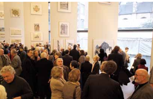
Ausstellungseröffnung „Felsen aus Beton und Glas“

Ein nur noch von wenigen Künstlern beherrschtes und selten gezeigtes Kunsthandwerk ist das Klöppeln von Spitzen – als Accessoires der Mode und Innenein-