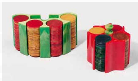
Ständer für Spielchips, USA, um 1930

Kersting gestaltet wurde. Das Modell VE 301 W wurde 1933 auf der Internationalen Funkausstellung in Berlin vorgestellt und gehörte bald darauf zur Standardausstattung eines jeden deutschen Haushaltes. Die Modellbezeichnung VE 301 sollte an den 30. Januar 1933, den Tag der Machtgreifung Hitlers erinnern.