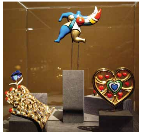
„Künstlerschmuck der Avantgarde“