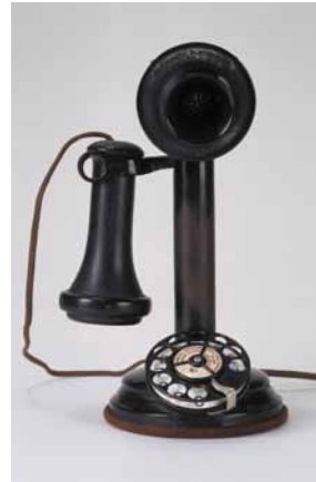
Telefonapparat ‚Candlestick‘, USA, 1918/19