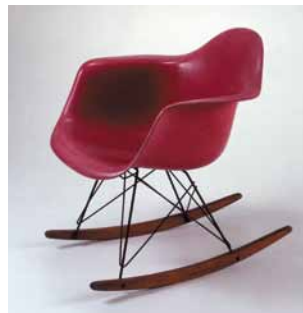
Charles und Ray Eames, Schaukelstuhl ‚Rocker‘, 1950

Ein Wunschobjekt jeder international orientierten Designsammlung ist der Schaukelstuhl ‚Rocker‘ , von Charles und Ray Eames (Inv. Nr. A 1946 w) aus dem Jahre 1950 Abb. 4 . Seine pinkfarbene Polyesterschale steht in reizvollem Kontrast zum schwarz lackierten Metallgestell und den warmbraunen Holzkufen, eine seltene Materialkombination, die auch die Experimentierfreude dieses großen amerikanischen Designerpaares dokumentiert. Polyester gehört zu den großen Entdeckungen der 40er Jahre. Seit 1947 wird diese Faser industriell hergestellt. Polyester-Fasern werden vor allem im Bekleidungsbereich eingesetzt aber eben auch - wegen ihrer Strapazierfähigkeit - im Möbeldesign. Die Sitzschale des ‚Rocker‘ besteht aus formge-