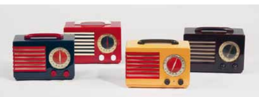
Norman Bel Geddes, Radiogeräte ‚Patriot 400‘, 1940

Wenig später konnte man durch chemische Veränderung auch farbiges Phenolharz als Werkstoff verwenden. Die kleinformatischen, an die Formsprache des Bauhaus erinnernden Salz- und Pfefferstreuer des amerikanischen Designers Russel Wright (Inv. Nr. K 1545 w) sind hierfür typisch aber ebenso diverse Jetonständern mit ihren vielfarbigem Chips (Inv. Nr. K 1557 w) Abb. 2 . Marketingaspekte und eine Begeisterung für neue Technologien und neue Verbrauchergelüste spiegeln sich vor allem bei der enormen Vielfalt der Kunststoffgehäuse