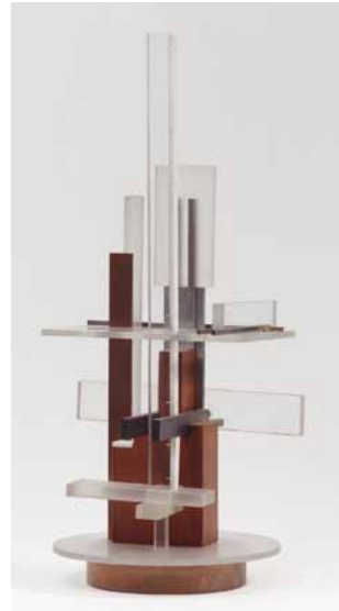
César Domela, ‚Improvisation Architectural‘, 1960