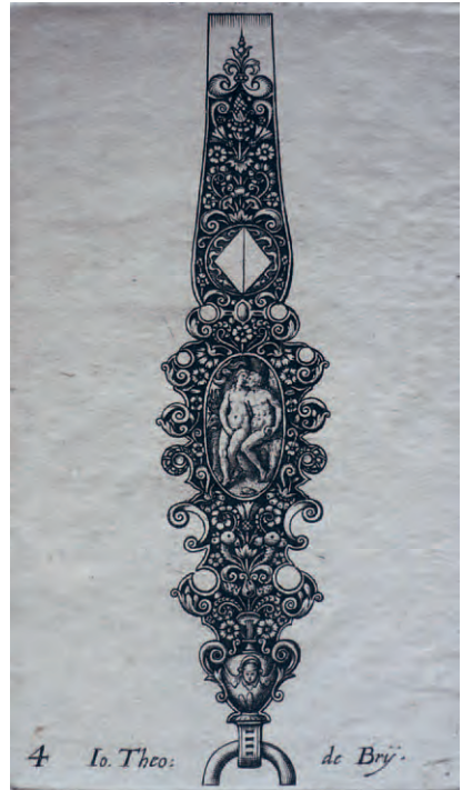
J. T. de Bry, Anhänger, Niederlande, 16. Jh.

Scheidenbeschläge, Gefäße oder Schließen entstanden. Häufig wurden diese von Goldschmieden in Form von schwarzen oder farbigen Emailarbeiten (Glasmelzarbeiten) umgesetzt. In der kunsthandwerklichen Ausgestaltung konnten die Feinheiten der grafischen Vorlagen jedoch nur zum Teil wiederholt werden. So orientierten sich die ausgeführten Werke zumeist nur hinsichtlich der äußeren