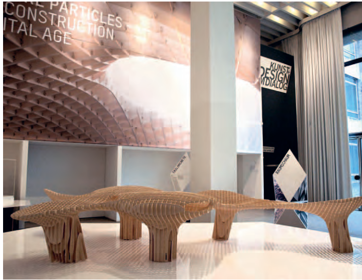
Jürgen Mayer H. Architects, Metropol Parasol, Sevilla, Spanien, 2004-2011

Die ungewöhnliche Ausstellungarchitektur basiert auf einem modularen Bau-