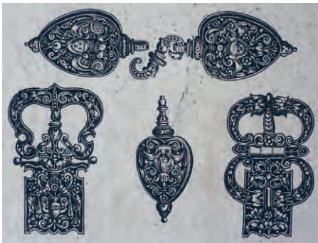
T. de Bry (nach), Agraffe und Schnallen, Niederlande, 16. Jh.

Wesentliche Charakteristika der Schwarzornamentdrucke sind die Verwendung von Schweifwerk und Schweifwerkgrotesken, die Dominanz der Fläche vor der Linie sowie ihre konkrete Zweckbestimmung. Schwarzornamente sind vorrangig als Vorlagen für Schmuck und Gerätschaften wie etwa Messerrücken,