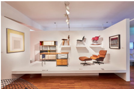
Ausstellungsansicht „Mid Century Design“

Im Obergeschoss beginnt die Präsentation mit der Nachkriegszeit bzw. der ersten US-amerikanischen und europäischen Internationale: dem Mid Century Design. Dieses ging zwar von den Vereinigten Staaten aus, fand aber rasch internationale Verbreitung. Ray (1912-1988) und Charles Eames (1907-1978), Arne Jacobsen (1902-1971), Gio Ponti (1891-1979) oder Hans Gugelot (1920-1965) zählen zu den bekanntesten Vertretern des Mid Century Modern. Aber auch der für die