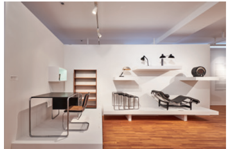
Ausstellungsansicht „Bauhaus“