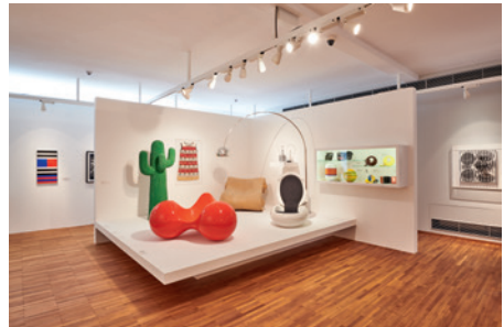
Ausstellungsansicht „Pop Art und Anti Design“

Der Rundgang setzt sich fort über Space Age Design in Gegenüberstellung zu Werken der Künstler-Gruppe „Zero“. In diesem Bereich konnte ein aufsehenerregendes Spiegelobjekt (1965) von Christian Megert (*1936) sowie die leuchtend-farbige Glas-Kunststoff-Plastik „Optochromie 76“ (1976) von Eric H. Olsen (1909-1986) erstmals in die Ausstellung integriert werden. Im sich anschließenden Bereich der Pop Art in Kombination mit Anti- und Radical Design gibt es einen weiteren Neuzugang zu bewun-