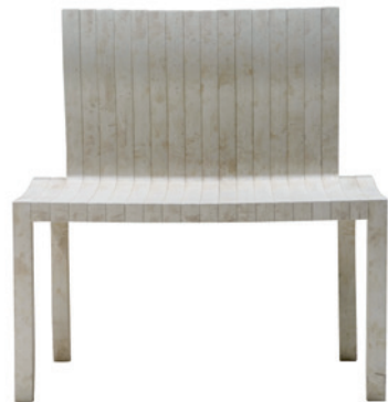
Shigeru Ban, 10-Unit-System, 2009