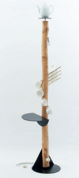
Gruppe Kunstflug, Kaffeebaum, 1984

Jahre unterzogen. Hier wurde insbesondere der Bereich „Neues Deutsches Design“ bestärkt. Als eines der markantesten Objekte fällt der „Kaffeebaum I“ (1984) der Gruppe Kunstflug ins Auge. Das Kombinationsmöbel aus rohem Holzstamm, Stahl- und Messingelementen sowie einfachen Geschirrtellen verlässt komplett die Regeln des Postulats der „Guten Form“ und